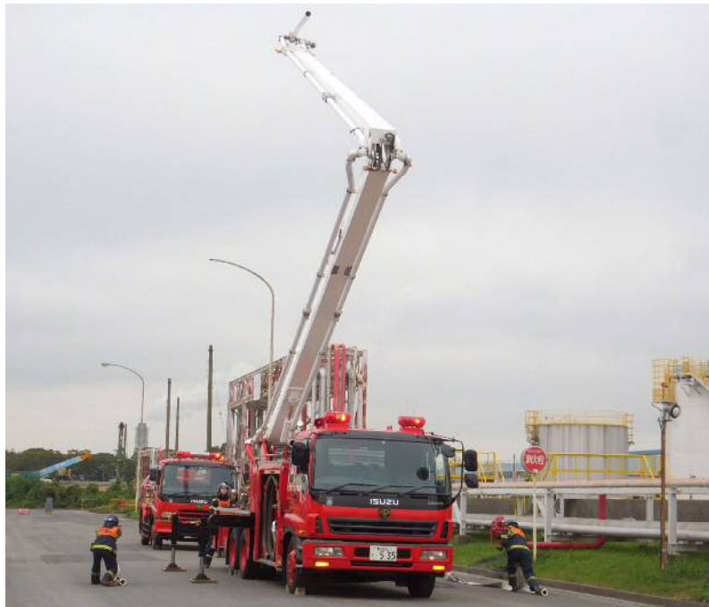
自衛防災組織の技能コンテスト訓練