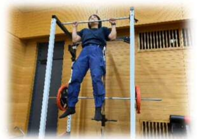
懸垂を毎当直欠かさずやります。男性にも体力で負けたくないです！！

普段は、同じ隊の先輩方と多種多様な災害現場に対応できるように、毎当直訓練を実施しています。いつ起こるか分からない災害に備え、知識、技術、体力を高め、救助隊員になれるよう頑張っていきます。