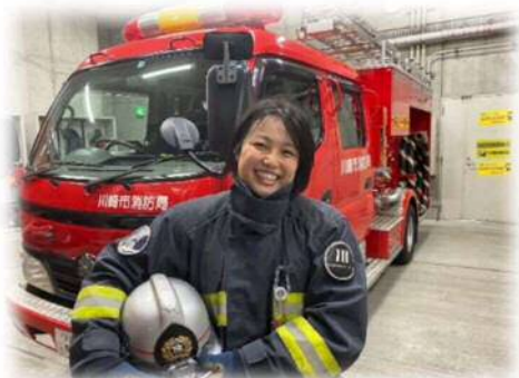
川崎消防署警防第2課調査係