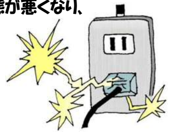
トラッキング現象が発生すると？

このトラッキング現象が繰り返されることにより、プラグの絶縁状態が悪くなり、ついには発火して火災になることがあります。