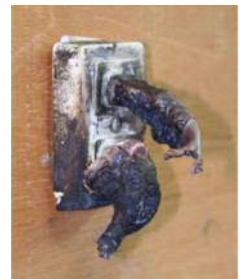
周りにもものがあつたらもっと大きな火事になるかも？