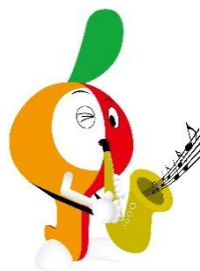
かわさきミュートン