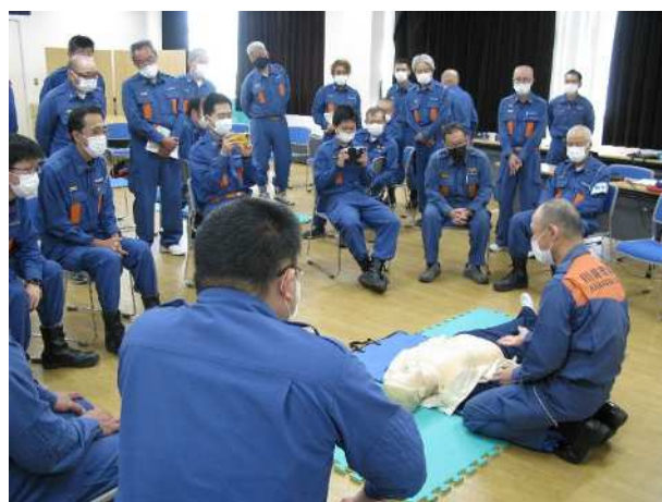
各グループに分かれて、実技訓練