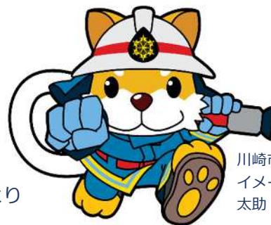
川崎市消防局 イメージキャラクター 太助

これに伴い、川崎市内 (※1) の 液化石油ガス販売事業者等に関する事務は 川崎市消防局 予防部 危険物課 (※2) で 行うこととなります。