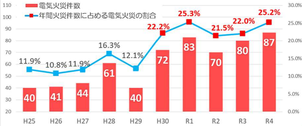
川崎市における過去10年間の電気火災件

電気火災とは、電気機器などが原因で発生する火災で、電気関係の火災が44件と、火災原因全体の約30%を占めており、近年、増加傾向となっています。