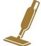
コードレス掃除機