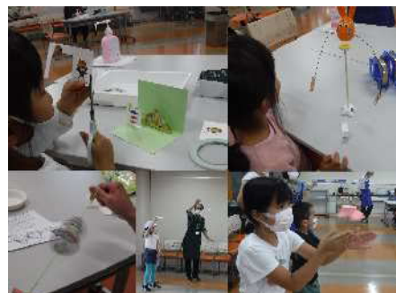
サイエンスワークショップの様子