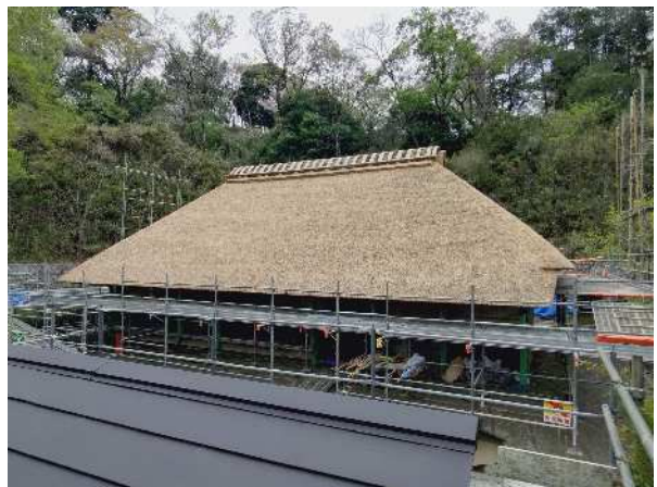
旧北村家屋根葺替工事