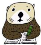
寺ッコ ラッコ界の王子