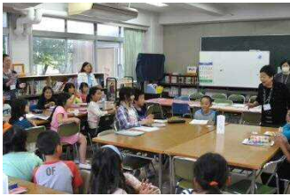
今日の勉強はここまで。 わくわくプラザに行く子は一緒に行きましょう