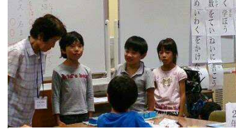
寺子屋先生や子どもの自己紹介 1年間、一緒に楽しく勉強しましょう