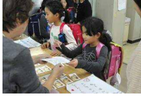
寺子屋に来たら、寺子屋カードを出して受付をします