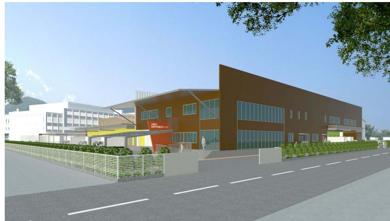
【エントランス外観】