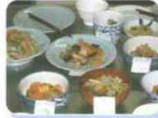
献立決定委員会にて献立の試食