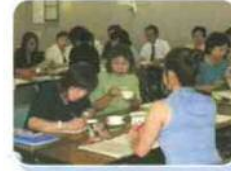
栄養士、給食主任による物資選定