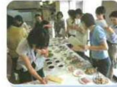
給食用物資新製品展示会の開催