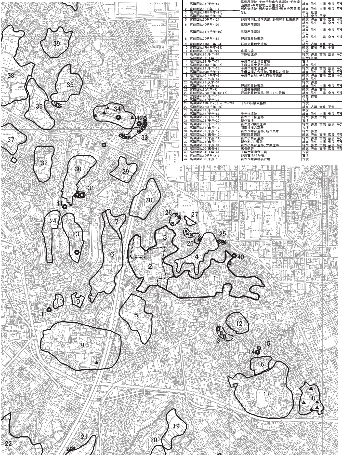
第6図 遺跡群周辺の遺跡