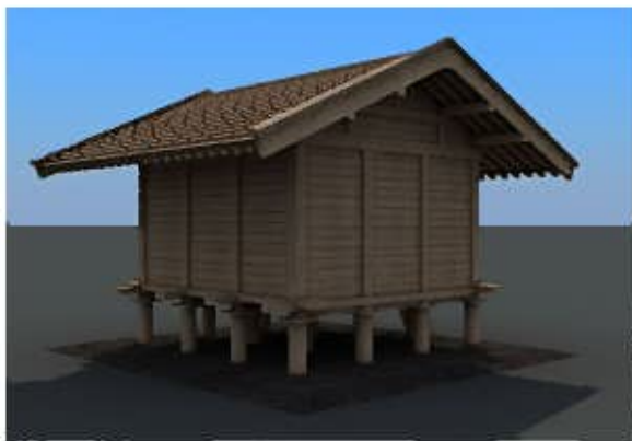
ARリーダーによるイメージ体験