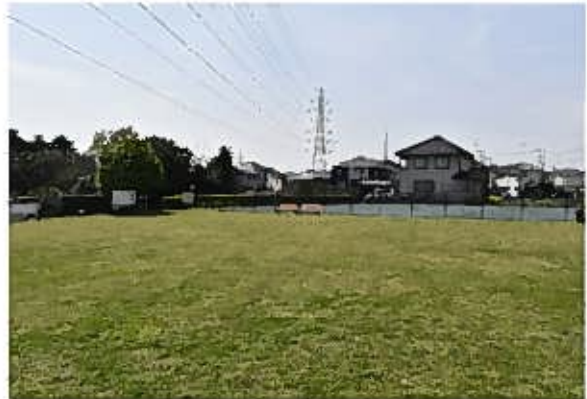
たちばな古代の丘緑地（東から）