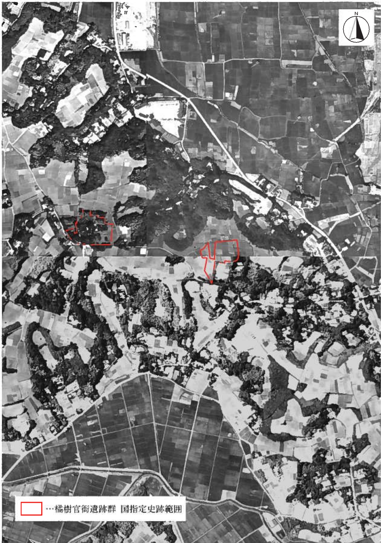
航空写真〔1947年米極東空軍撮影写真を合成〕