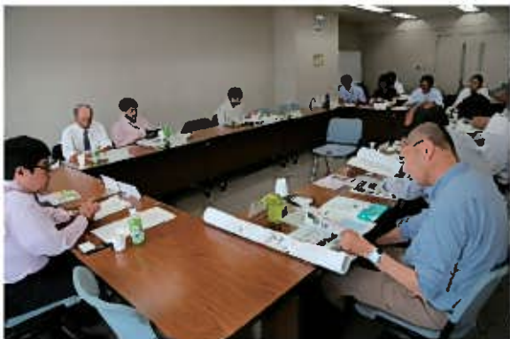
委員会風景（2016年6月9日）