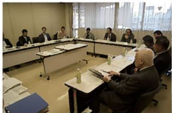
委員会風景（2016年12月6日）