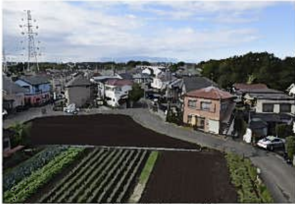
たちばな古代の丘緑地西側（東より）