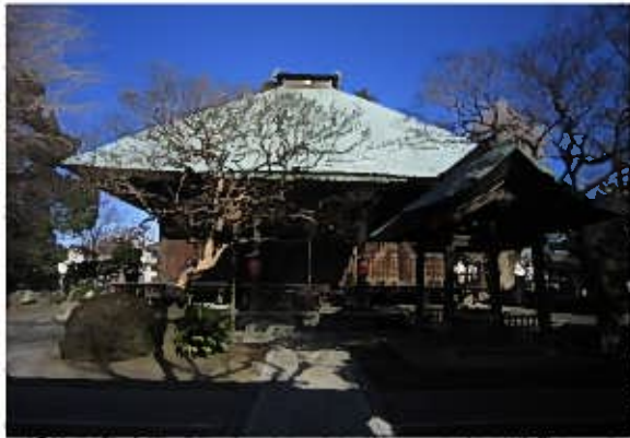
影向寺 薬師堂（神奈川県指定文化財）