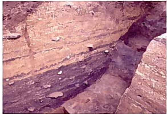
SB0030 (塔跡) [影向寺遺跡]