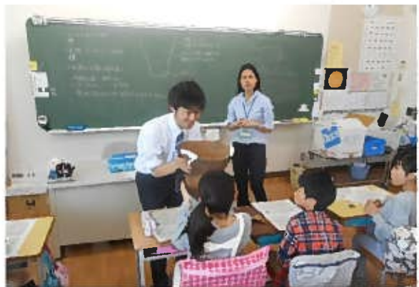
市内小学校における出前授業