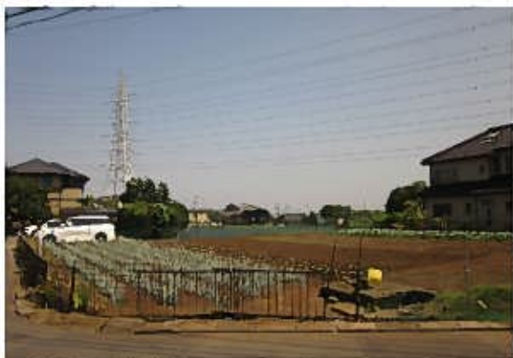
たちばな古代の丘緑地西側地域（北から）