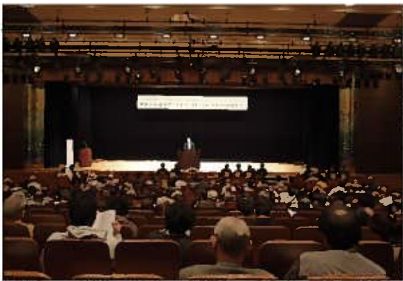
国史跡指定記念シンポジウム（高津市民館大ホール）