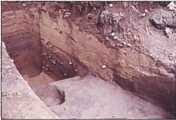
SB0030 (塔跡) [影向寺遺跡]