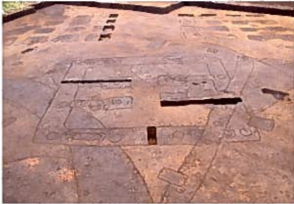
SB0030・SB0031・SB0032〔橋樹郡家跡〕(北西から)