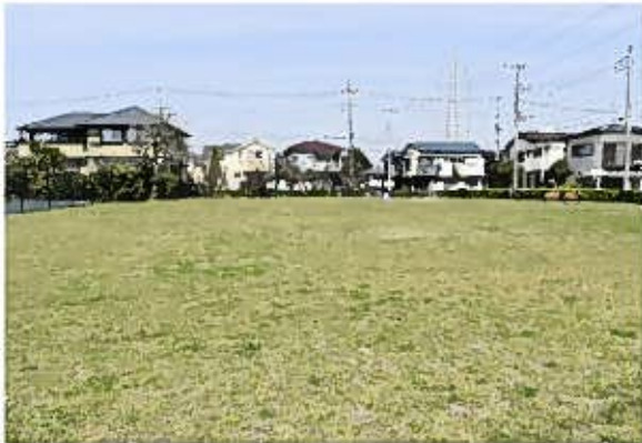
たちばな古代の丘緑地（南から）