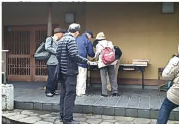
古代のたちばなスタンプラリー（影向寺）