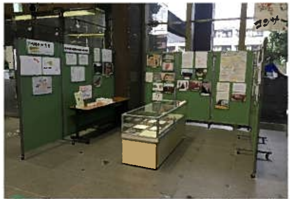
高津区役所ロビーにおけるミニ展示