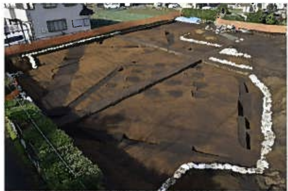
調査状況〔橋樹郡家跡〕(南東から)