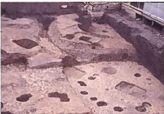
SB0080 [影向寺遺跡] (南から)