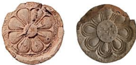
影向寺遺跡出土瓦