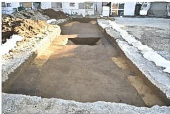
SD0395〔橋樹郡家跡〕(南から)