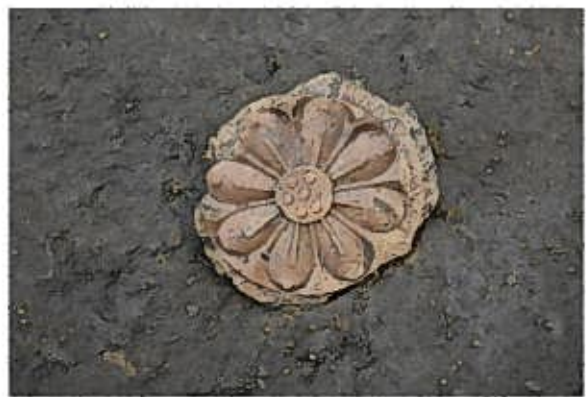
軒丸瓦検出状況 [影向寺遺跡]