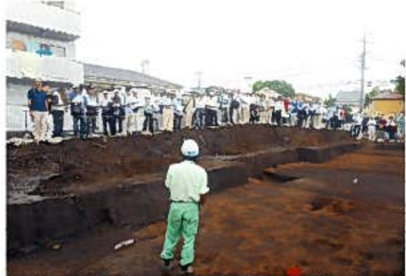
現地見学会〔橋樹郡家跡(第17次調査)〕