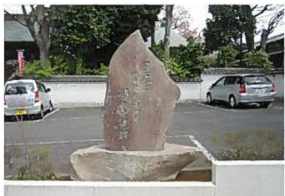
影向寺 国指定記念碑