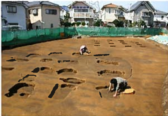
調査状況〔橋樹郡家跡〕(東から)