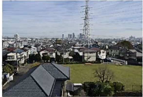
たちばな古代の丘緑地東側（西より）