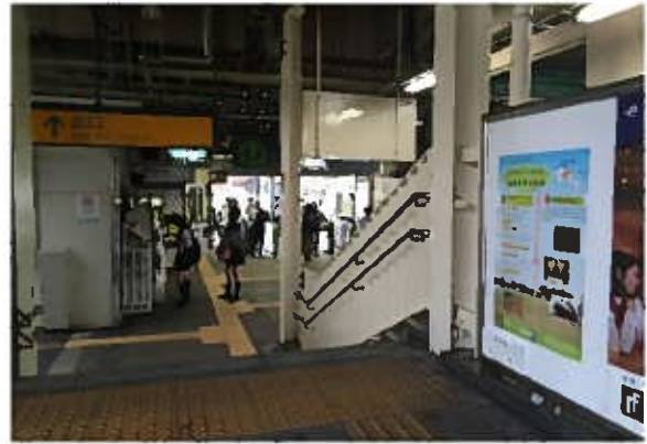
国史跡指定記念事業ポスター掲示（稲田堤駅）