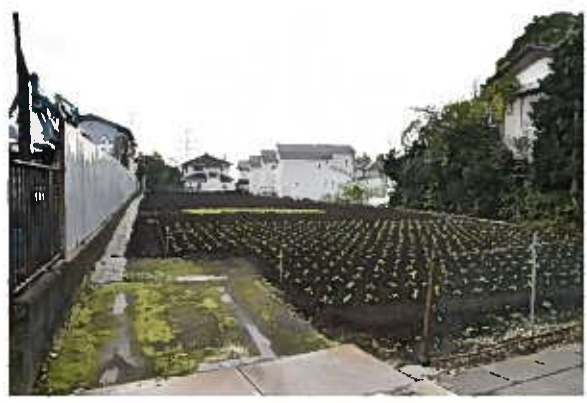
橘樹郡家上原宿地区現状（西から）