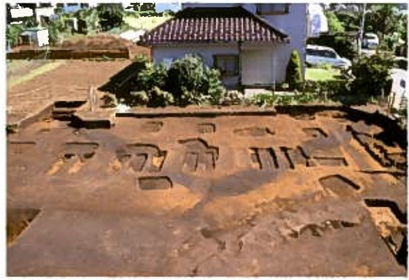
SB0055〔橋樹郡家跡〕(西から)