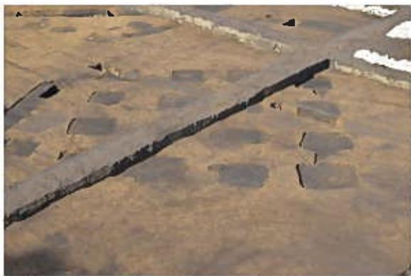
SB0085〔橋樹郡家跡〕(南東から)