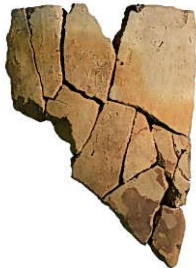
「无射志国在原評」銘文字瓦