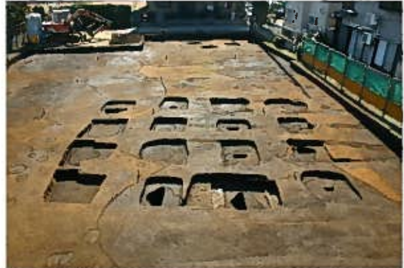
SB0200〔橋樹郡家跡〕(北から)