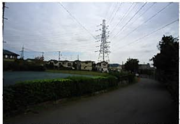
たちばな古代の丘緑地隣接道路（西方面）