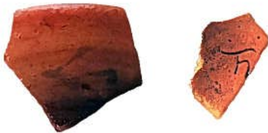
橘樹郡家跡出土土器