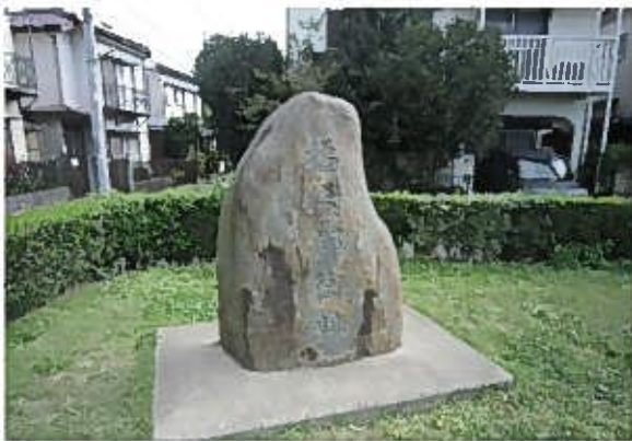
たちばな古代の丘緑地石碑