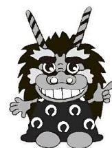
川崎市文化財保護推進キャラクター シッシー君