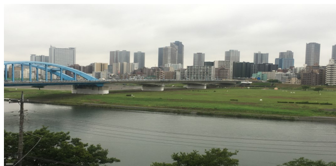
東京側から見た川崎