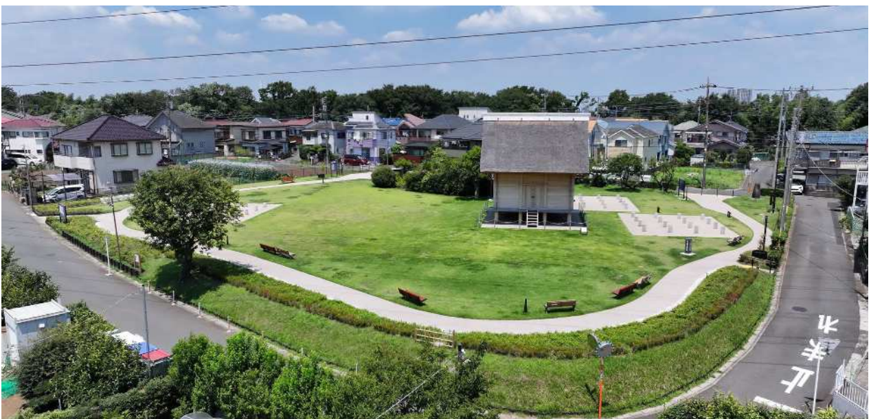
写真1 橘樹歴史公園（南東から）

そして、令和6（2024）年5月18日に「橘樹歴史公園」としてオープンし、一般に供用を開始しており、多くの人に利用されている。