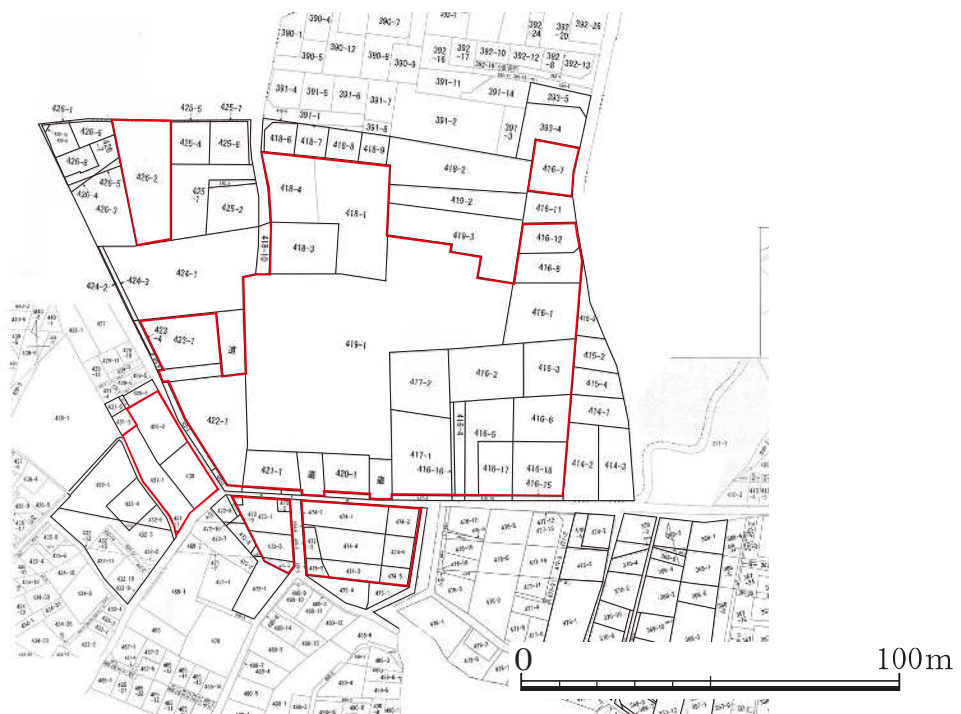
第10図 史跡橘樹官衙遺跡群指定範囲図（影向寺遺跡）