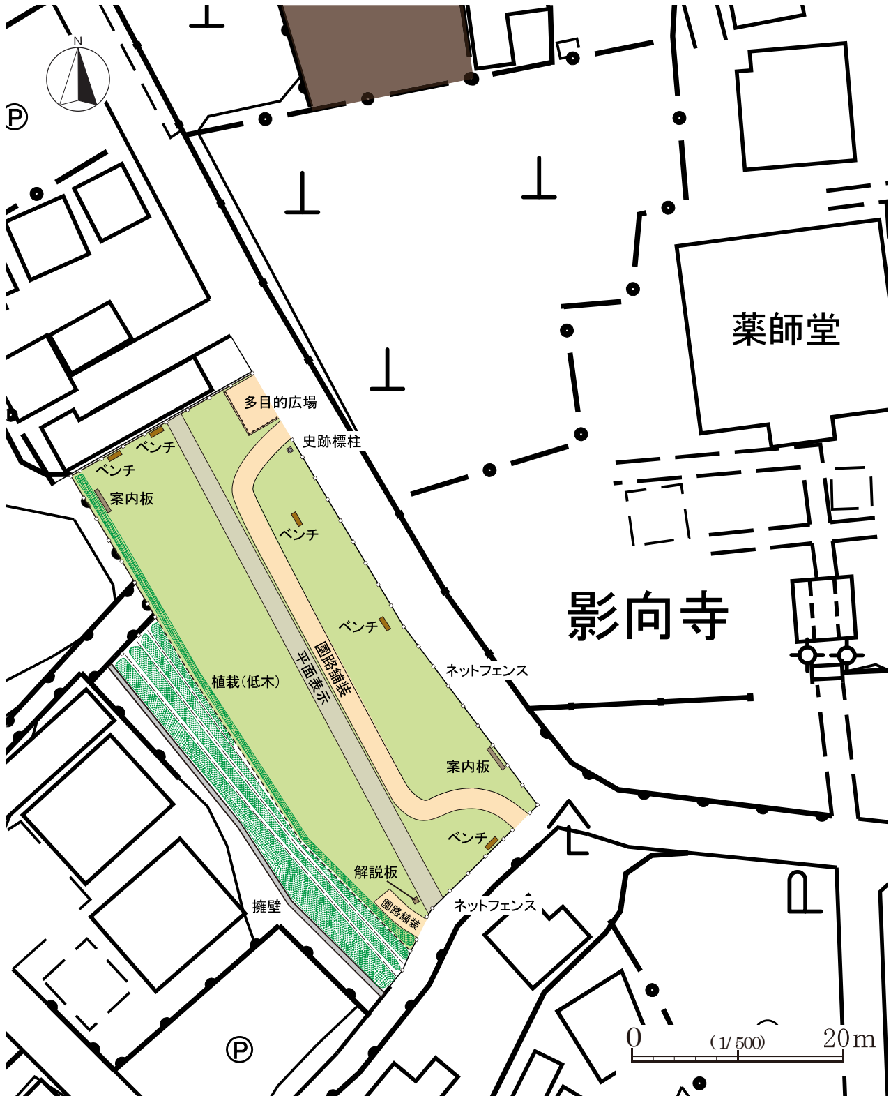
第14図 史跡整備地①（古代寺院ゾーン）の整備計画（S = 1/500）

史跡整備地③は、川崎市高津区に所在することから、史跡整備の実施に際しては高津区役所道路公園センターに実施設計の作成を依頼し、市教委が協力しながら、第4年次に市教委が作成した基本設計を基に、史跡整備の実施設計を作成する。