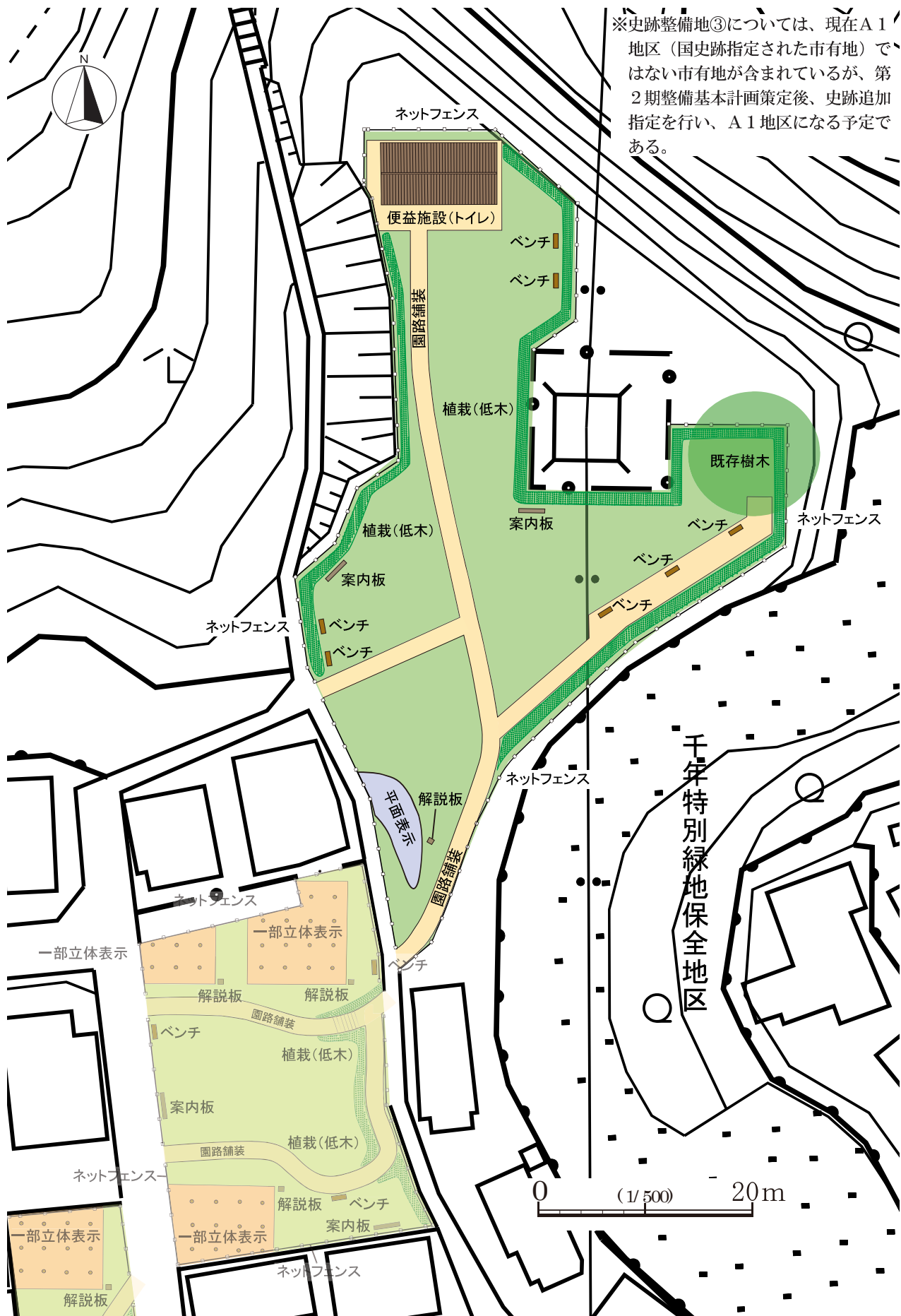
第16図 史跡整備地③（正倉ゾーン）の整備計画（S=1/500）