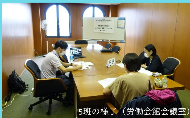
5班の様子（労働会館会議室）

グループワークでは、「ホールでの鑑賞型イベント」や「気軽に参加できるイベント」、「イベントがなくても日常的によりたくなる施設」など、各班から様々なご意見が出されました！（意見の詳細は裏面でご紹介します！）