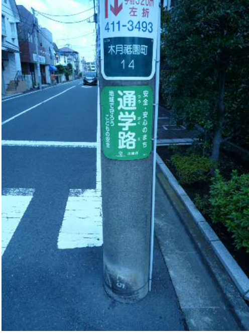
電柱への通学路巻き付け表示