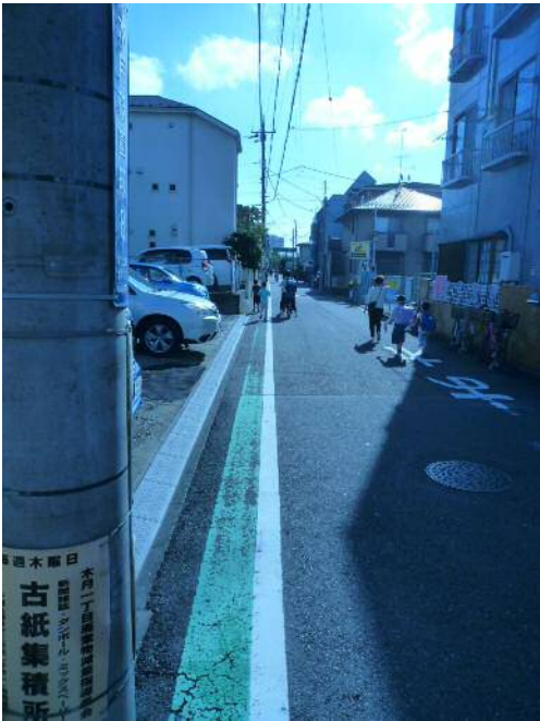
歩道のグリーンベルト