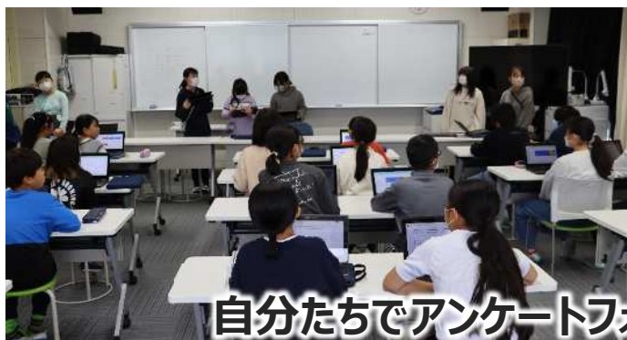
自分たちでアンケートフォームを作成