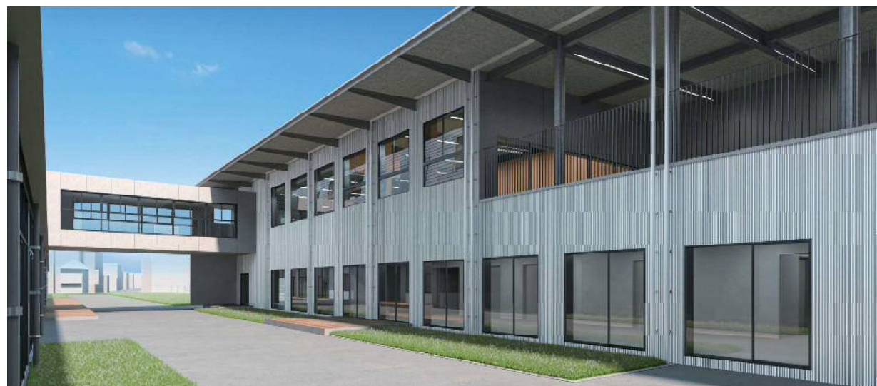
体育館外観パース