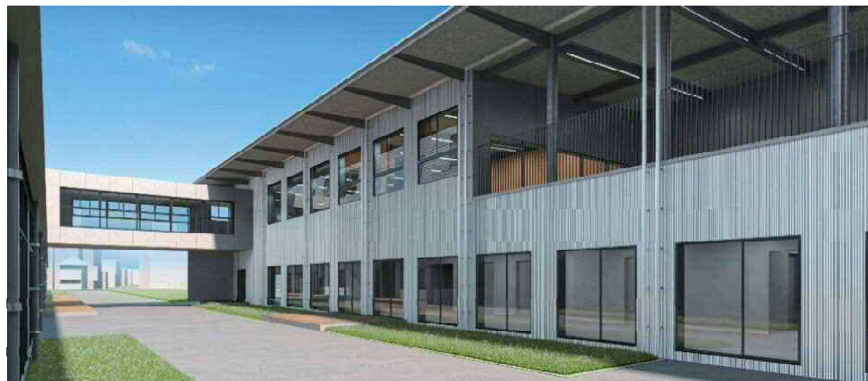
体育館外観パース