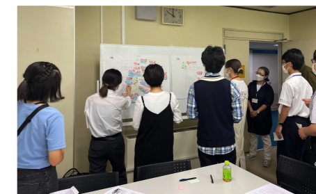
共感した意見に「いいね！シール」を貼ってもらいました

第2回までに出たやりたいことを図面に落とし込み、それらを実現するためのルールや工夫を考えました。ポスターセッション*にて意見交換を行い、共感したアイデアにいいねシールを貼りました。