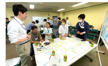
各グループで真剣に話し合っていました

前回の意見交換で出た幸市民館・図書館の良い点や改善点等を踏まえ、グループに分かれ、「ちょっと通いたくなる秘訣」と題して新しい施設でやりたいことなどの意見交換を行いました。