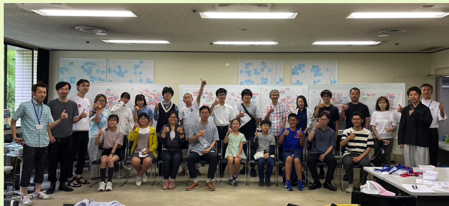
最後は参加者全員で記念撮影を行いました！

他にも本紙に載せられないほどのたくさんの意見をいただきました！ 今後の検討の参考にさせていただきます。ありがとうございました！！