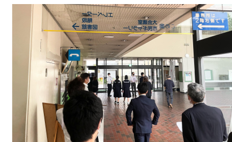
話し合う前に館内の見学を行いました

幸市民館・図書館の見学を行い、施設の雰囲気やどのような諸室・機能を持っているのかを確認した後、グループに分かれ、幸市民館・図書館の良い点や改善点、新しい施設に期待することなどの意見交換を行いました。