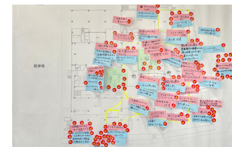
たくさんのアイデアが出されました！

川崎市では、幸市民館・図書館が今後も市民の生涯学習活動を支える拠点となるよう、施設の老朽化対策等の内容や範囲を検討しています。幅広い世代の方々にご利用いただけるように、こんなことをやりたい、どんな過ごし方がしたいかなどを考えるワークショップを開催しました。