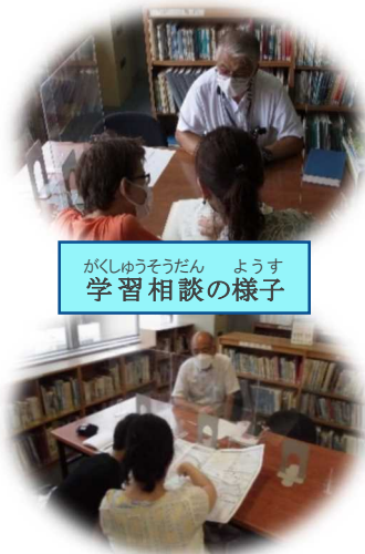
がくしゅうそうだん ようす 学習相談の様子

なつやす しゅくだい じゅうけんきゅう てっだ 夏休みの宿題、自由研究をお手伝いします！