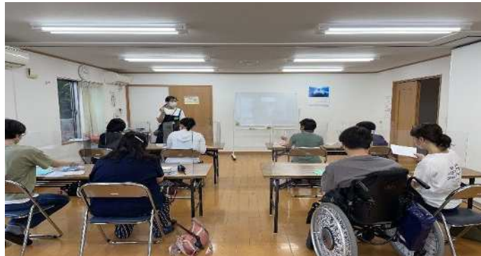
市民自主事業「かたひらほっとカフェ」開催の様子

今後、ここでのつながりが社会参加の一步となり、これが地域活動に参画につながる場となることを目指していきたい。