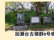
加瀬台古墳群9号墳