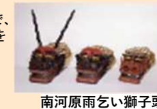
南河原雨乞い獅子頭