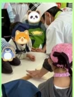
お手本を前のめりで見ています