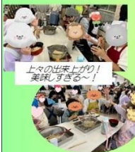
上々の出来上がり! 美味しすぎる〜