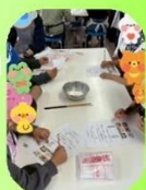
うどんクイズ! ちよっと難しい?