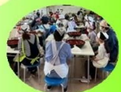
説明を聞いて 「はるしくお楽しみま〜す!!」