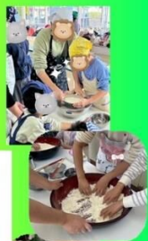
おーいおーいおーい