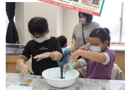
▲小学生向け体験講座