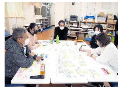
▲川崎小でのワークショップの様子