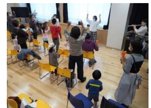
▲乳幼児親子向けイベント

※4校のお試し開放に関わった方たちとの振り返り会を2月25日、高津中学校特別活動室で開催予定