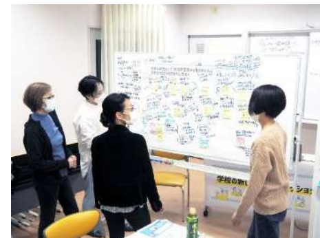
▲百合丘小でのワークショップの様子