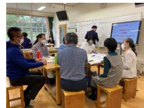
▲土橋小でのワークショップの様子