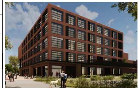
【富士見公園から見た外観】