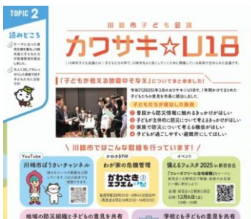
<教育だよりかわさき>