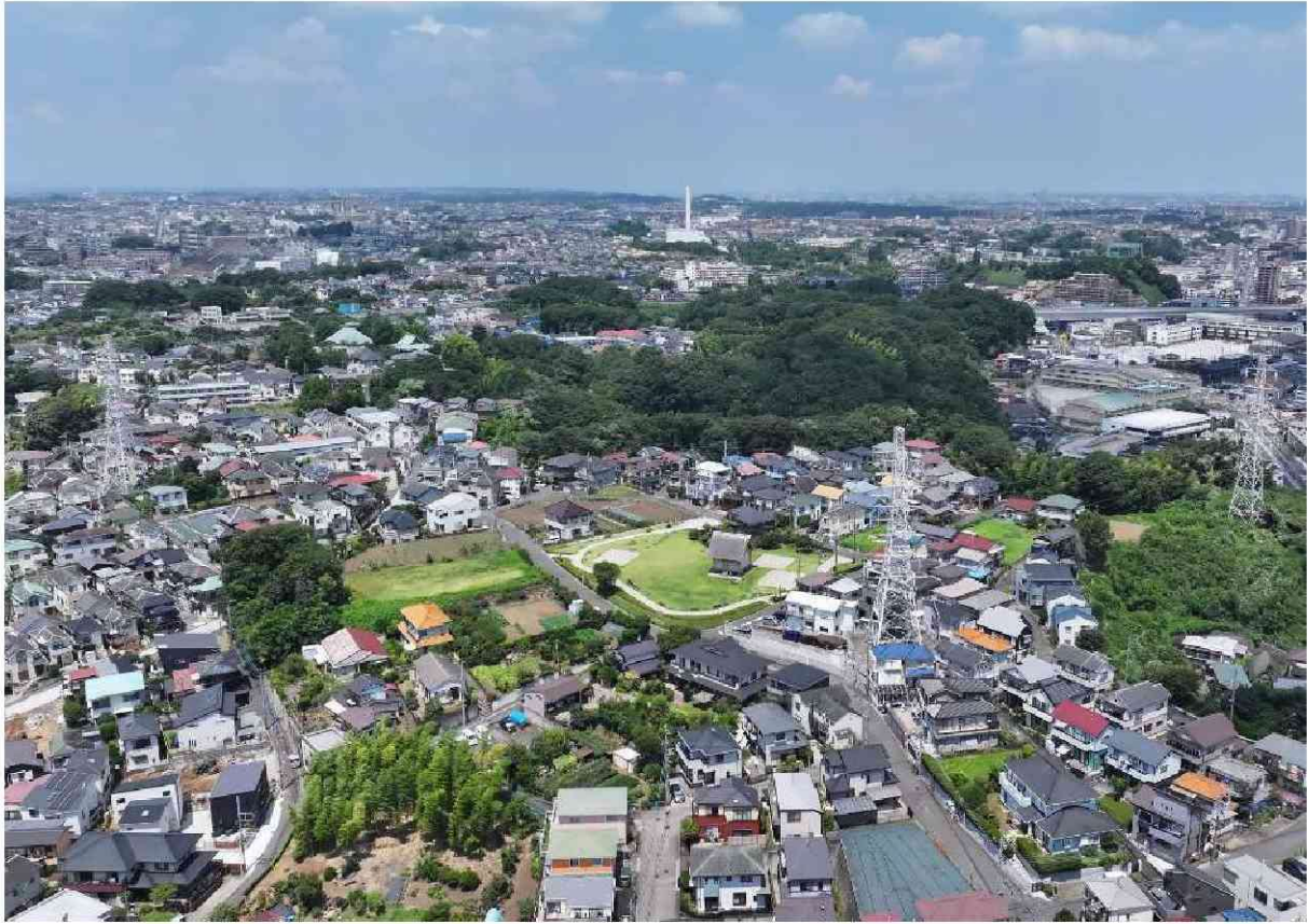
千年伊勢山台遺跡〔橘樹郡家跡〕の空中写真（東から）