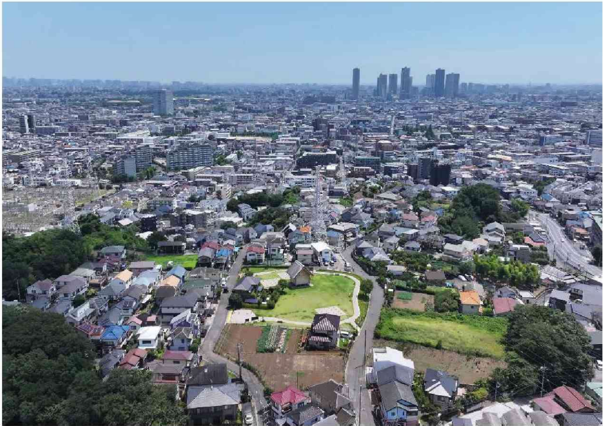
史跡橘樹官衙遺跡群周辺の空中写真（武蔵小杉方面を望む）