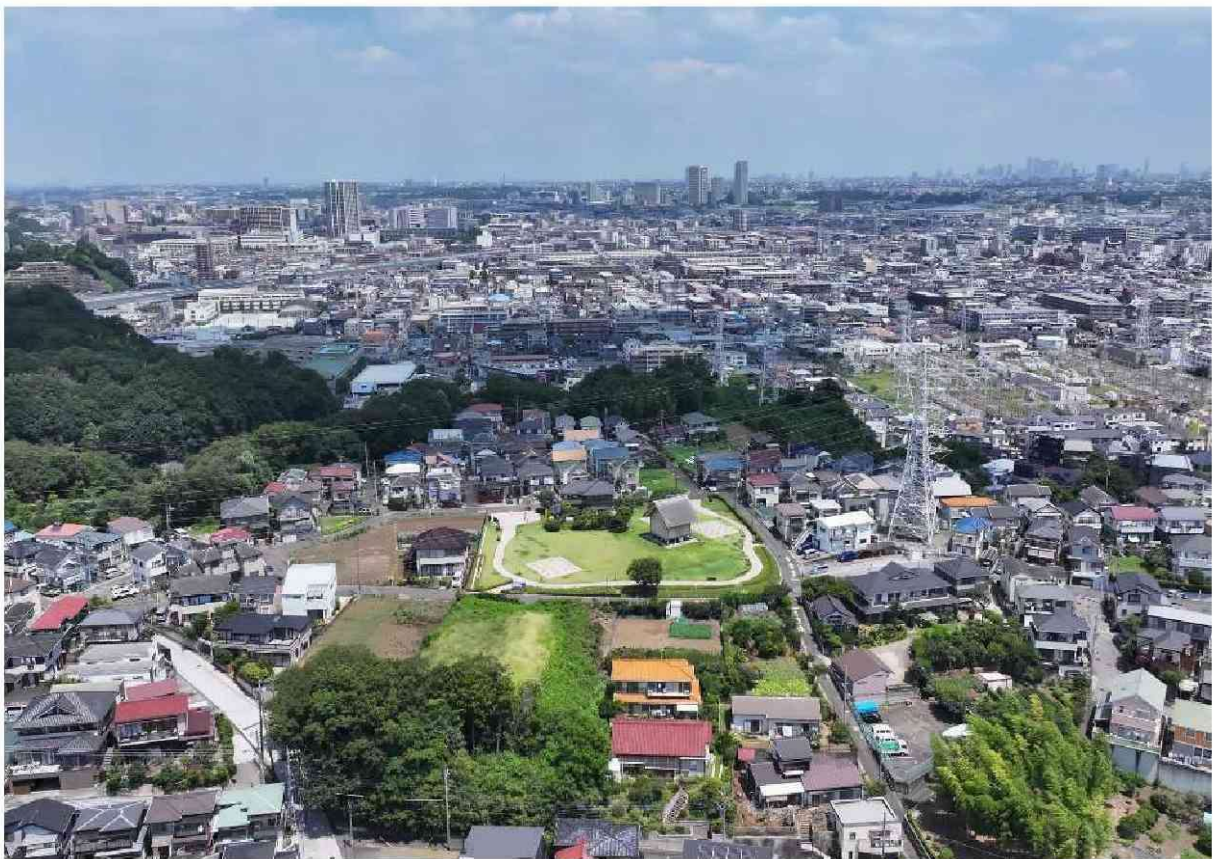
史跡橘樹官衙遺跡群周辺の空中写真（新宿方面を望む）