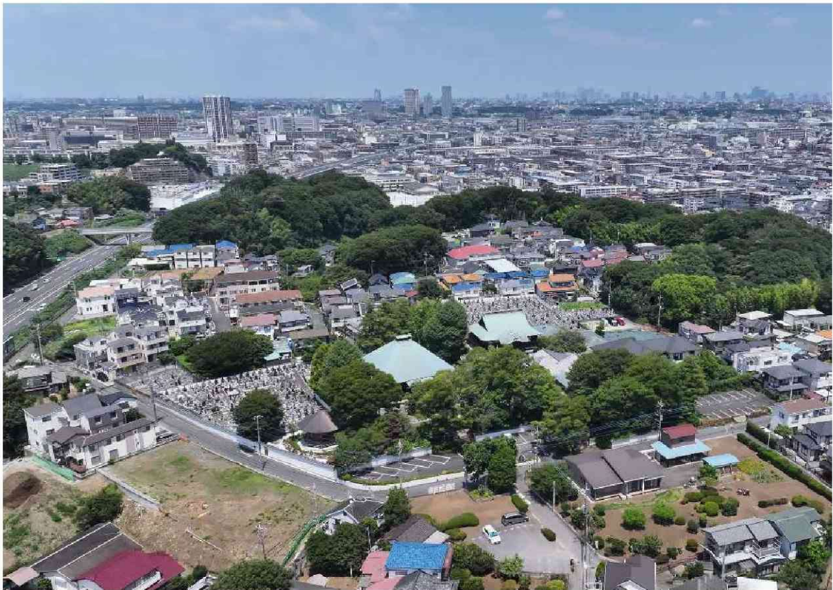
影向寺遺跡の空中写真（南南西から）