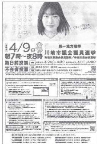
【タブロイドチラシ（新聞折込）】