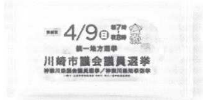
【ウェットティッシュ】