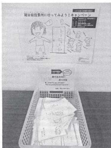
【行ってみようキャンペーン】 （折りきれないおりがみ）