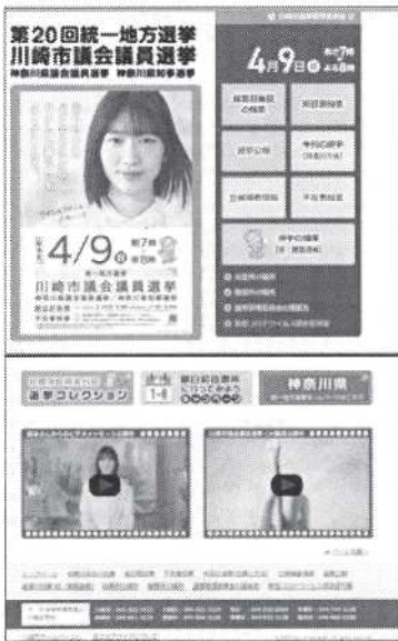
【特設ホームページ】