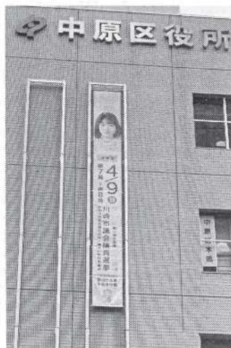
【中原区役所懸垂幕】