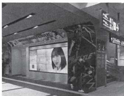
【武蔵小杉駅 こすぎアイ】