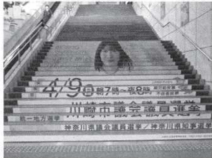
【川崎アゼリアステップ広告】