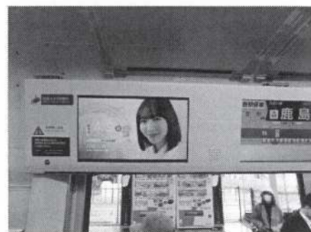
【南武線トレインチャンネル】