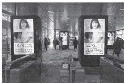
【京急ステーションビジョン】 （フルジャック）