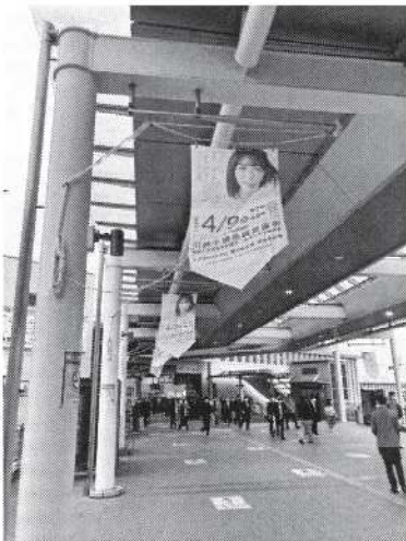
【JR・小田急線登戸駅連絡通路バナー】