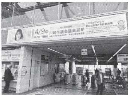
【小田急線新百合ヶ丘駅 スーパーシート