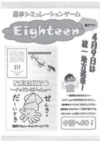
【エイティーン】 (高校3年生向け)