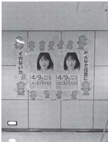
【ノクティプラザ ポスター掲示】