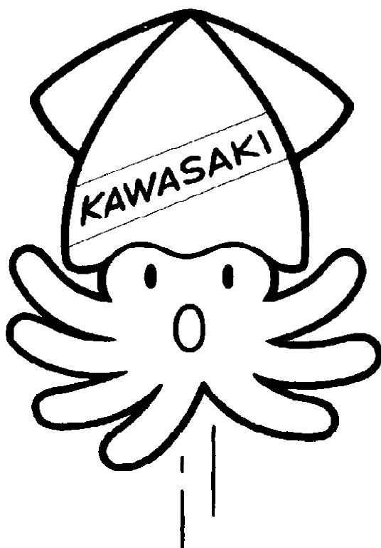
選挙マスコットの 「イックン」です。