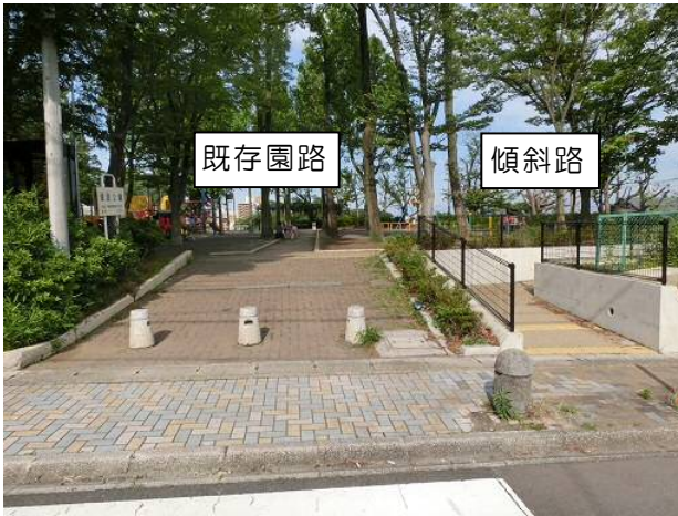
既存園路及び傾斜路（道路側）の状況