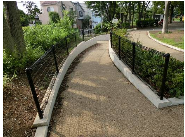
傾斜路（広場側）の状況