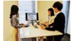
立ちミーティングスペース

本庁舎でのフリーアドレス(グループアドレス)の導入や、各種ミーティングスペースの設置等により、仕事の内容に合わせて働く場所を選択できる、より働きやすい職場づくりに取り組んでいます。