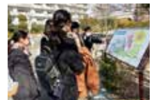
新規採用職員フォロー研修「先輩職員と学ぶ・まち歩き」の様子