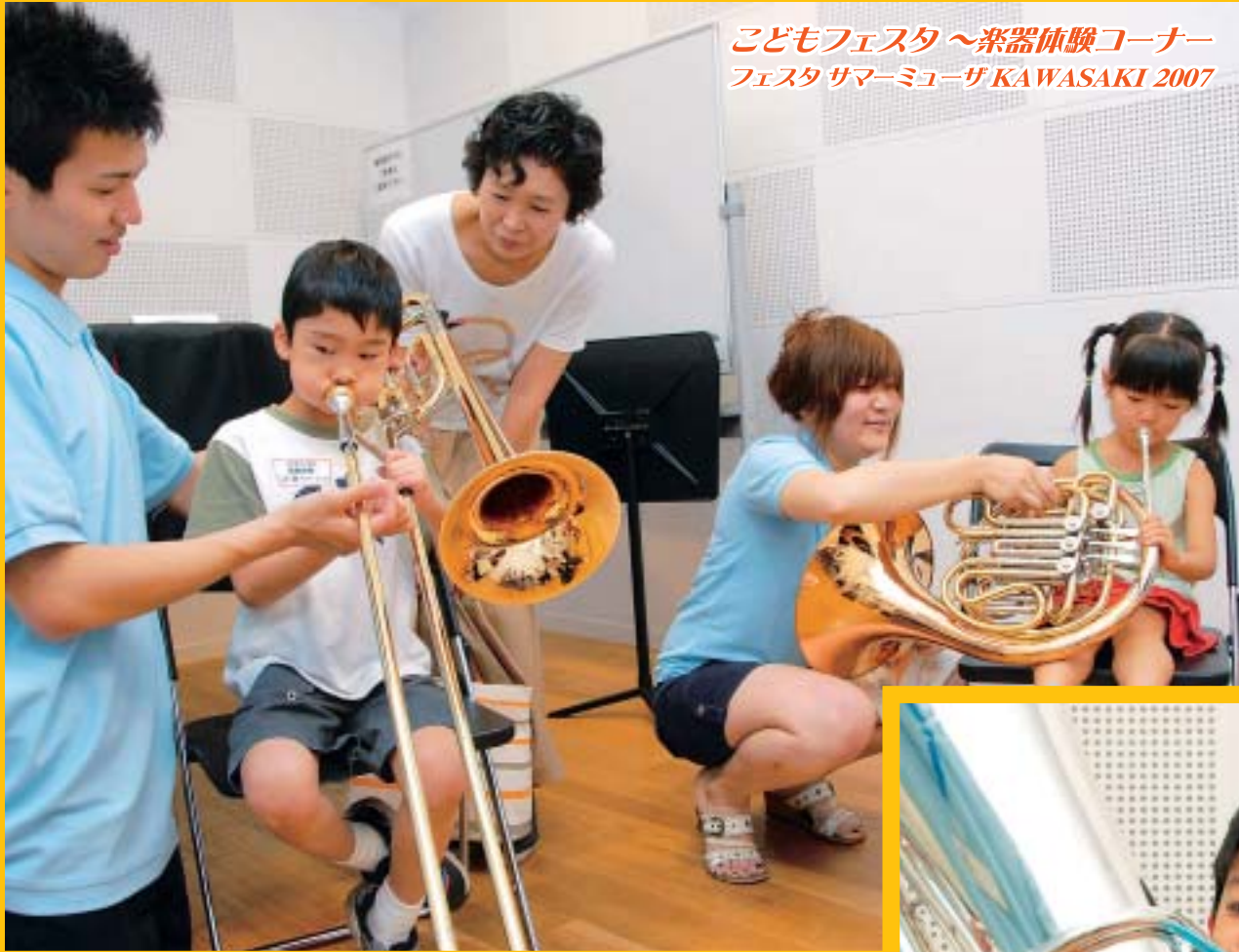
こどもフェスタ～楽器体験コーナー フェスタサマーミュージック KAWASAKI 2007

インターネットから議会の会議録を閲覧できる「会議録検索システム」に、「トピックス検索」機能を追加しました。最近の質疑で出た代表的なキーワードがあらかじめ表示されており、クリック一つで検索が可能です。(アドレスは題字下参照)