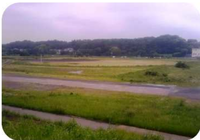
旧日本ハム球場グラウンド

現在、川崎市が管理している硬式野球場は1箇所（等々力球場）しかありません。等々力球場のある等々力緑地（中原区等々力）は再編整備が予定されていることから、再編整備期間中の代替グラウンドの確保を考慮しました。