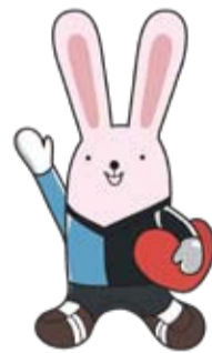
川崎市自殺対策推進キャラクター「うさぎっぴー」

どに向けた自殺対策相談支援研修や、教育機関への出前講座などを開催するほか、24年度からは、市の理容組合と連携し理容師向けの講習を実施している。関係局で調整し、より適切に支援策の情報提供に努めていく。