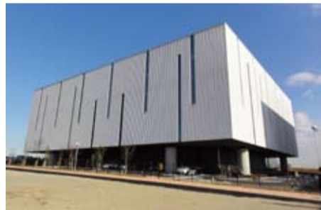
25年3月に「まちびらぎ」が行われる川崎生命科学・環境研究センター(LiSE)外観(川崎区殿町地区)

能が必要と認識している。川崎生命科学・環境研究センター(LiSE)内には研究者がくつろげるカフェを設置することとした。またコンビニエンスストア、レストランなども民間活力を生かす導入を検討したい。さらに市とその周辺には既にまち全体で保育所や住宅、教育施設など、研究者の家族を支援できる機能が整っているため、それらの機能を紹介できる支援体制などを整えたい。