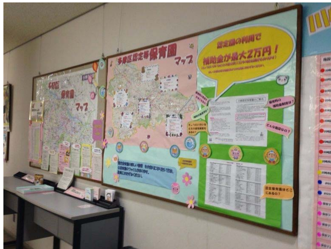
【保育園マップや川崎認定保育園の紹介】