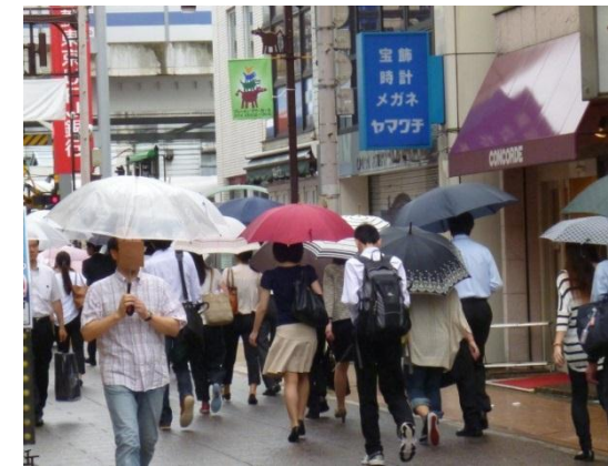
雨天時の様子(7月4日 7時30分頃撮影)