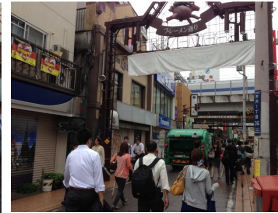
車両が通る様子(7月4日 8時10分頃撮影)