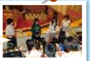
議長・副議長から修了証の授与と記念品の贈呈