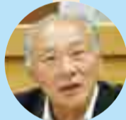
菅原 進 副議長