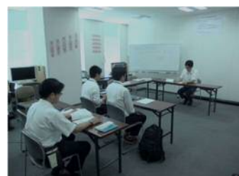
運行管理者研修(初級)