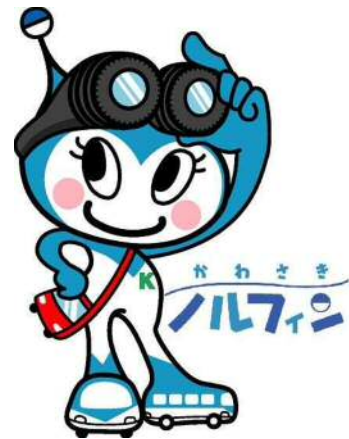
市バスイメージキャラクター 「かわさきノルフィン」

本書は、道路運送法及び旅客自動車運送事業運輸規則(昭和 31 年運輸省令第 44 号)に基づき、川崎市バスが平成 27 年度に実施した輸送の安全に関する情報及び平成 28 年度の取組について、輸送の安全に関する基本方針や輸送の安全に関する目標及び目標の達成状況、事故に係る情報等を公表するものです。