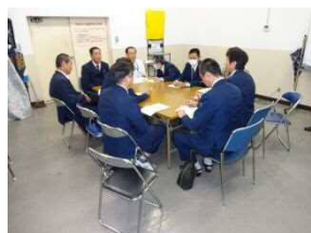
グループワーク研修