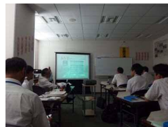
新規採用者等研修