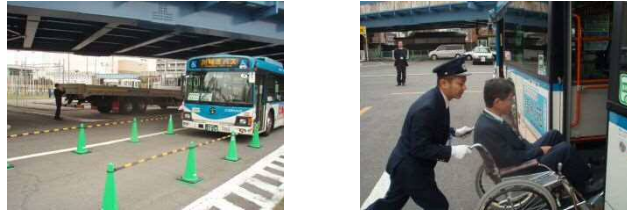
運転技能コンクール