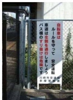
自転車駐輪場への注意看板設置

4 営業所(塩浜・井田・鷲ヶ峰・上平間営業所)にある車両のドライブレコーダーを更新し、営生営業所を含む全営業所の機器性能を向上させるとともに、全営業所の車両の車内カメラを1基増設(5カメラ化)し、輸送安全性の確保などへの更なる活用に取り組みます。