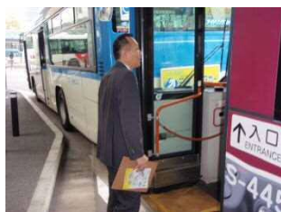
駅頭での街頭指導