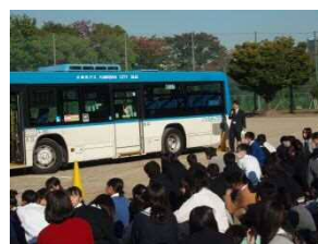
交通安全教室 (住吉高等学校)