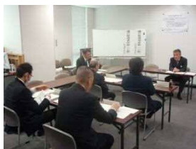
運行管理者研修 (一般・上級)