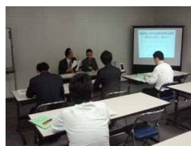
交通局初任者研修