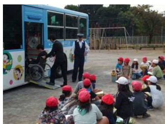
交通バリアフリー・安全教室