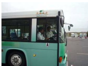
エコドライブ研修