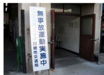
無事故運動の実施