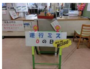
営業所での運行ミス防止強化日の実施