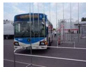
安全運転技術向上研修