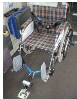
巻き取り式車いす固定ベルト