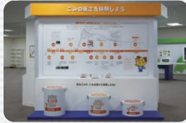
8 ごみの重さを体験しよう