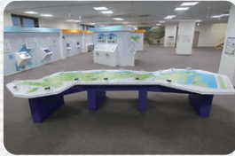
13 地域の自然を知ろう