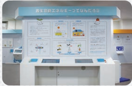
11 再生可能エネルギーってなんだろう