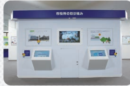
16 市役所の取り組み