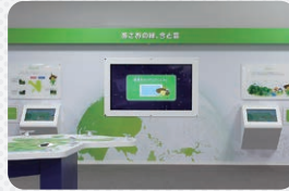
14 あさおの緑、今と昔