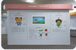
3 環境問題ってなんだろう