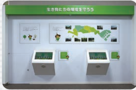
15 生き物たちの環境を守ろう