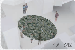
2 空から見た王禅寺