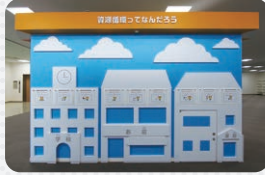
4 資源循環ってなんだろう