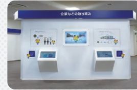
18 企業などの取り組み