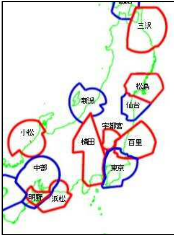
関東周辺の進入管制区 (図1)

* ラプコン (RAPCON: Radar approach control の略)