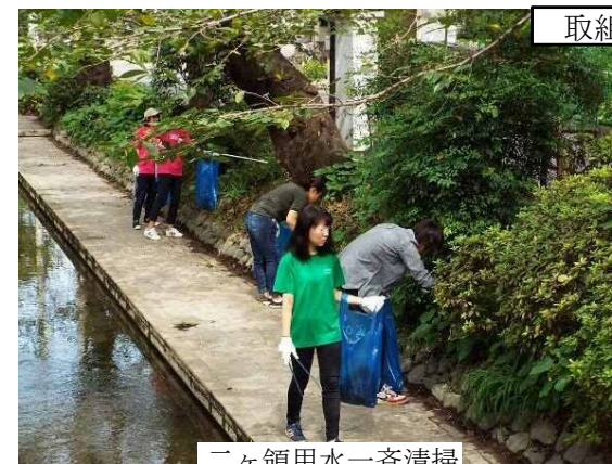
二ヶ領用水一斉清掃