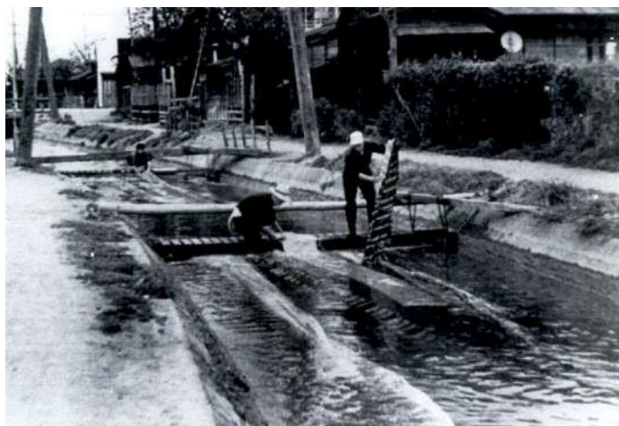
昭和29年当時の二ヶ領用水