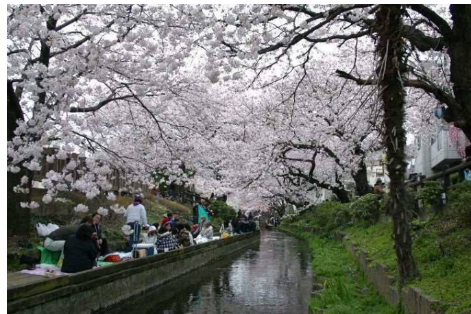
親水整備箇所(多摩区宿河原周辺)