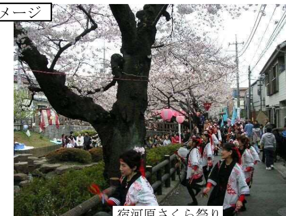
宿河原さくら祭り