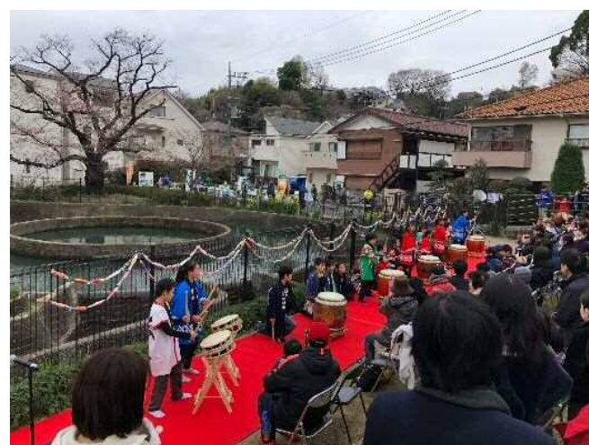
連携・協働のイメージ (久地円筒分水におけるイベント)