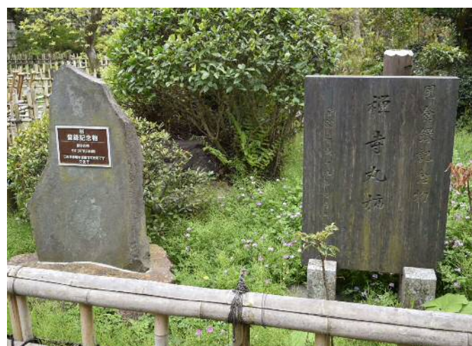
禅寺丸柿の登録プレート設置状況