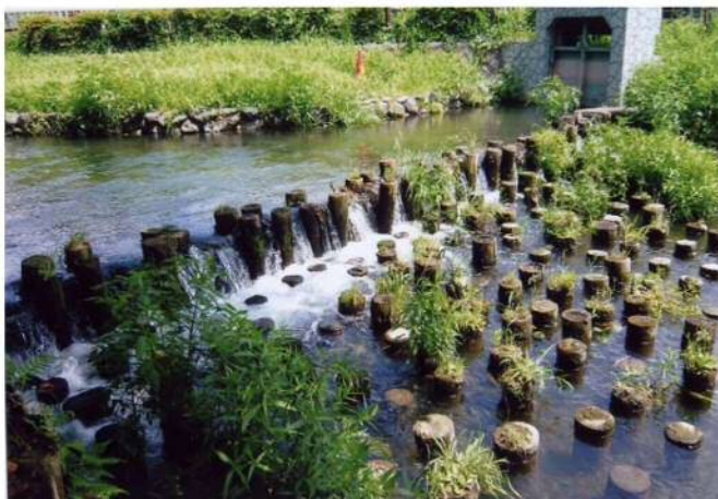
名残(草堰)がある箇所(多摩区布田周辺)