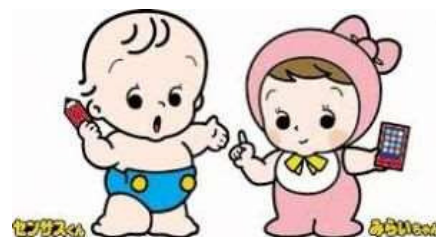
総務省統計局キャラクター (センサスくん、みらいちゃん)