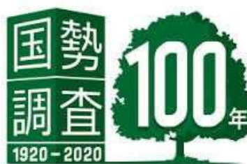
国勢調査 100年記念ロゴ