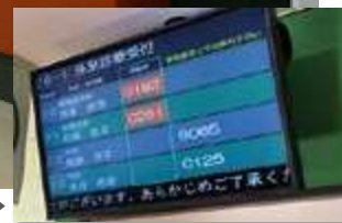
診察順番モニター▶