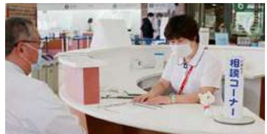
医療安全・相談コーナー