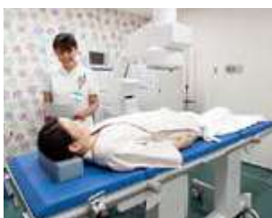
体外衝撃波結石破碎装置 1990年に川崎市内で第1号を導入して以来、当院では3台目