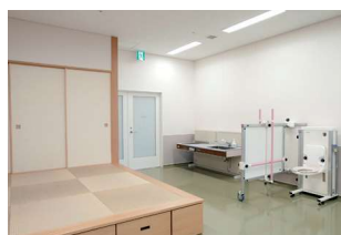
日常生活動作訓練用の 畳スペース