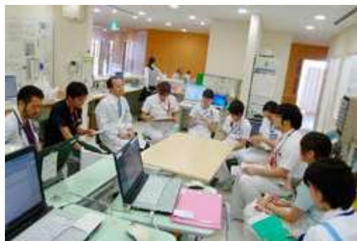
糖尿病治療にあたる多職種によるチームの合同カンファレンス

また、高齢者の病状評価と在宅ケア・施設ケアへの移行を支援するとともに、緩和ケア病棟も設置しています。