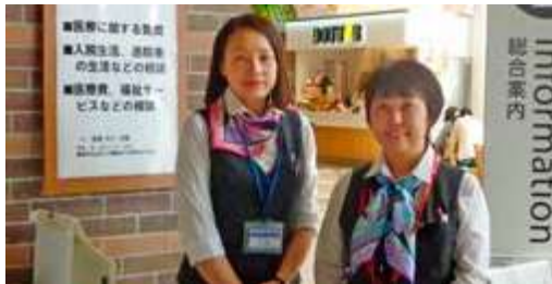
来院者を迎えるコンシェルジュ