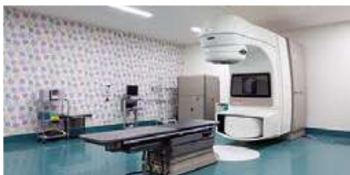
放射線治療室(リニアック)