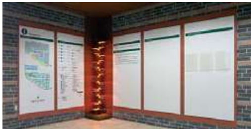
エントランス掲示板

1・2階吹き抜けで、自然光を利用した全面ガラス張り。中央にシンボルツリーを設置し、木のぬくもりを感じさせる暖かでゆったりとしたエントランスホールとなっています。