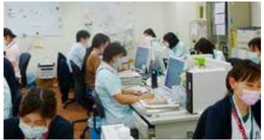
様々な職種で構成されたチームで連携に取り組んでいます。