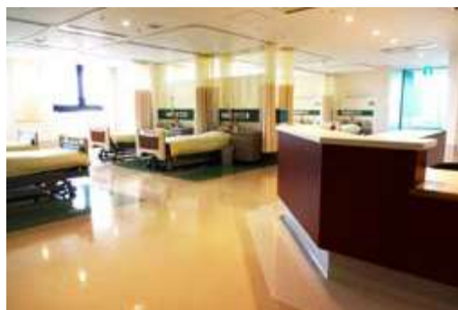
救急後方支援病床