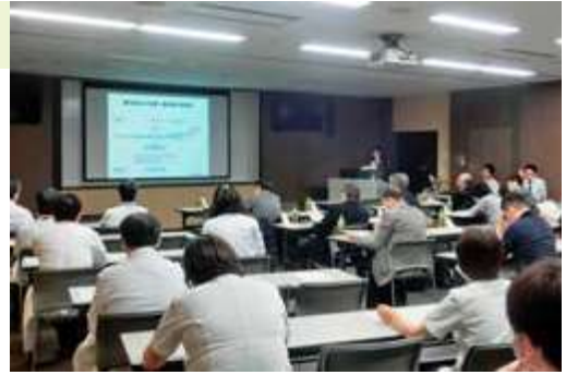
地域の医療機関との症例検討会風景