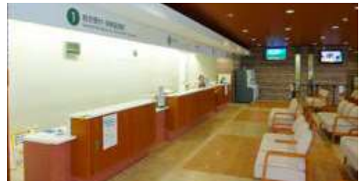
総合受付カウンター