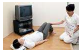
尿失禁外来 (尿もれ予防の体操指導)

● 各種専門外来を設け、患者さんがかかりやすい外来を目指しています。(ストマ外来・緩和ケア外来・尿失禁外来・在宅酸素療法外来など)