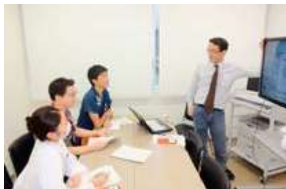
24時間使用できる医師看護師研修室