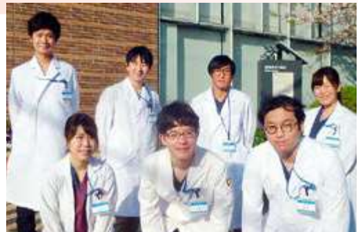
若い力が病院に活気を与えています