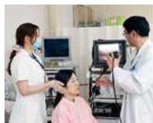
耳鼻咽喉科外来 (嚥下内視鏡検査)

● 各種専門外来を設け、患者さんがかかりやすい外来を目指しています。(ストマ外来・緩和ケア外来・尿失禁外来・在宅酸素療法外来など)