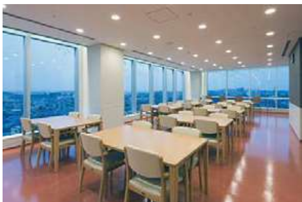
ラウンジからは横浜方面や富士山が望めます