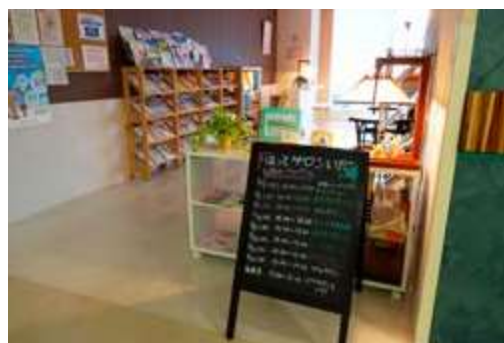
がんサロン「ほっとサロンいだ」