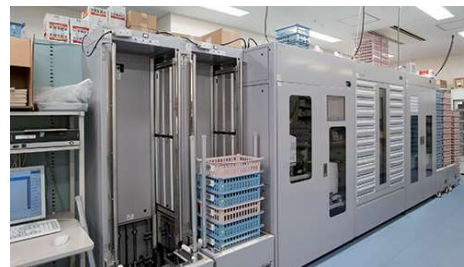
全自動注射薬払出装置