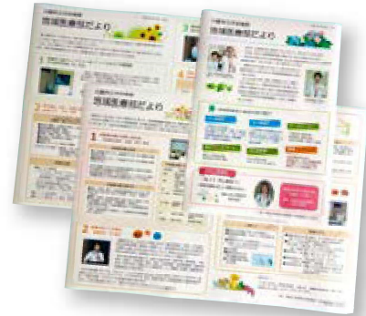
広報誌「地域医療部だより」