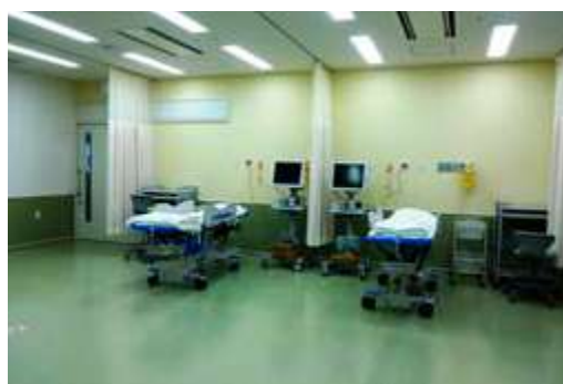
中等症対応スペース

「市民ニーズに応える救急!」を基本コンセプトに医療スタッフの総力を挙げて成人疾患の二次救急医療の充実・強化を図ります。