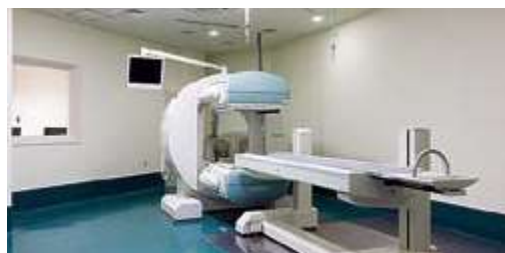
アイソトープ(核医学)検査室