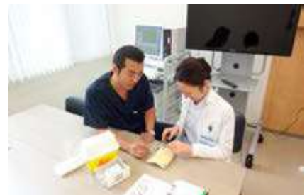
指導医による熱心な指導