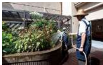
中庭の手入れをする園芸ボランティア