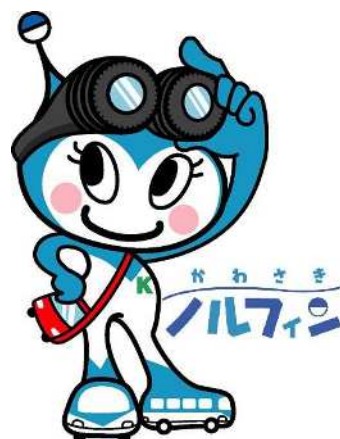
市バスイメージキャラクター 「かわさきノルフィン」

本書は、市バスの輸送の安全に関する基本方針、令和 3 年度に実施した輸送の安全に関する事項、令和 4 年度の目標と取組等の情報についてとりまとめたもので、道路運送法及び旅客自動車運送事業運輸規則（昭和 31 年運輸省令第 44 号）に基づき、公表するものです。