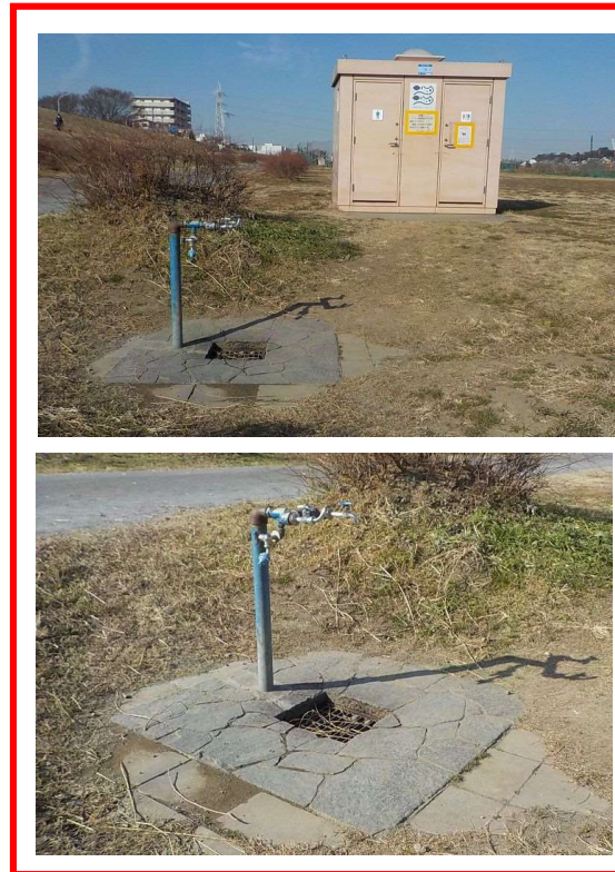
■ 中流 (トイレ・水飲み場)