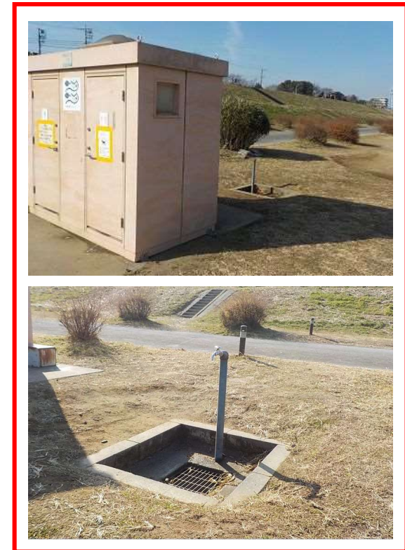
■ 下流 (トイレ・水飲み場)