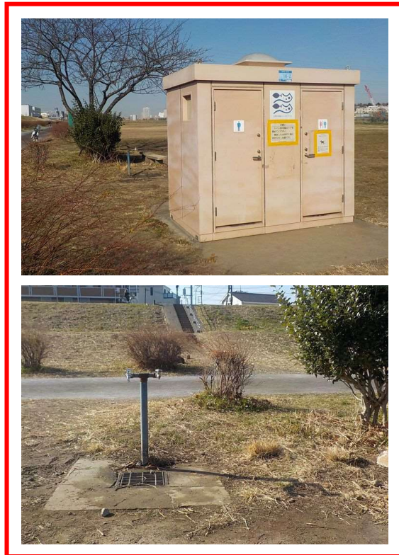
■ 上流 (トイレ・水飲み場)