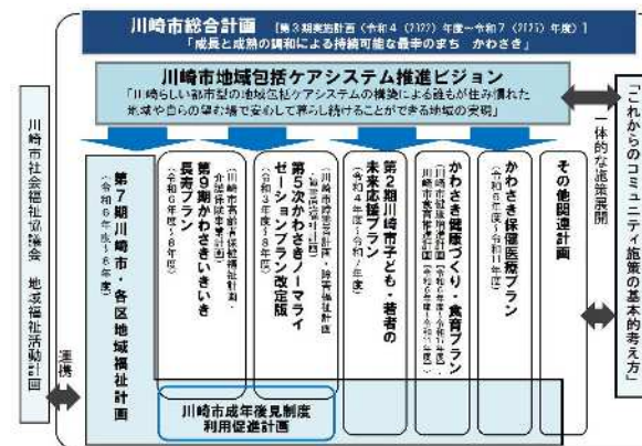
※図2「第7期川崎市地域福祉計画の位置付けと関連個別計画の関係性」

・「地域包括ケアシステム推進ビジョン」との関係では、 福祉に関する上位計画 としての位置づけに鑑み、推進ビジョンとの関連性を強め、地域課題の解決を図るために、住民の視点から地域福祉を推進していくための行政計画の1つとして、地域福祉計画を策定する。 ※図2参照